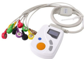
HOLTER 12 CANALES 48 HORAS