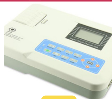
ELECTROCARDIOGRAFO 01 CANAL CONTEC