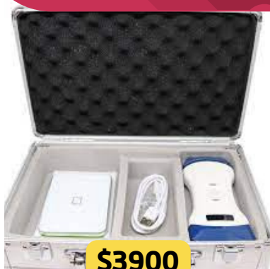
EQUIPO PARA ECOGRAFIA. SONOSTAR CONVEX, LINEAL Y SECTORIAL.