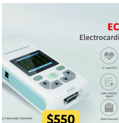
ECG PORTÁTIL CONTEC.