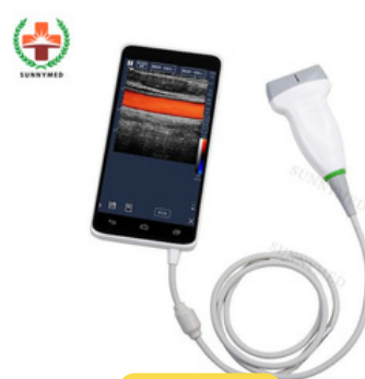
EQUIPO DE ECOGRAFIA TRASNDUCTOR LINEAL CON DOPPLER.