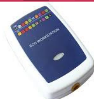
ELECTROCARDIOGRAFO BLUETOOTH NO MÁS PAPEL..